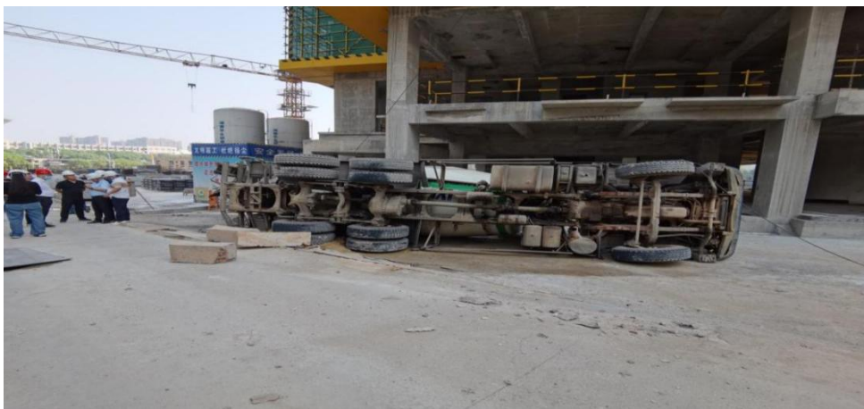
“9·29”车辆伤害事故现场照片（二）